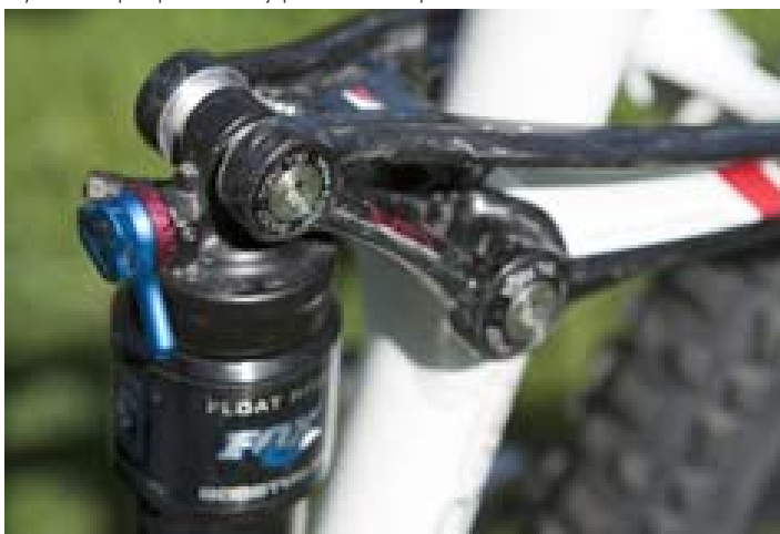
Páčka tlumiče je snadno přístupná, jen při přepínání tří módů modrým kolečkem je třeba zastavit.