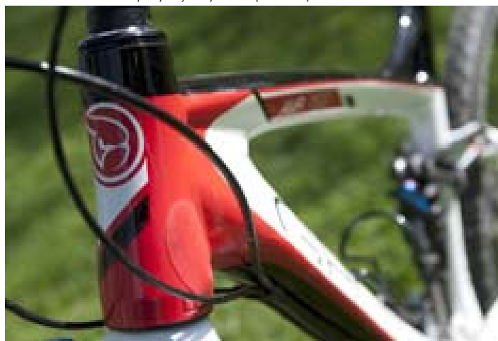
Kónická hlavová trubka a její masivní spojení se spodní a horní trubkou zvyšuje pevnost přední části.