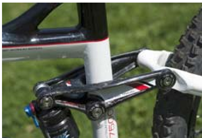
Masivní karbonová monocoque kyvka je uchycená k čepům šrouby s Torx hlavou.