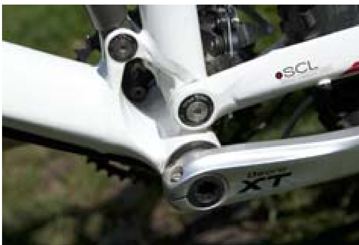
Zvýšení tuhosti při úspoře materiálu je patrné ve středové partii.